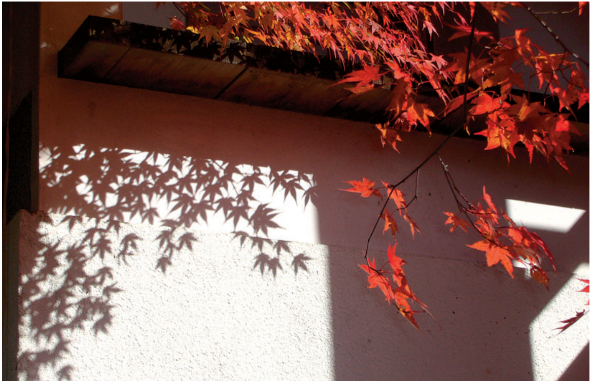
拝殿正面左の紅葉

★発行日 平成27年11月23日 ★発行所 大倭出版局 〒631-0042 奈良市大倭町1の12 ☎(0742)44-0015 ★印刷 大倭印刷製 ★定価 1部 250円 年間購読料3,000円(送料共) ★郵便振替 01050-6-67002 大倭出版局 URL http://www.ohyamato.jp