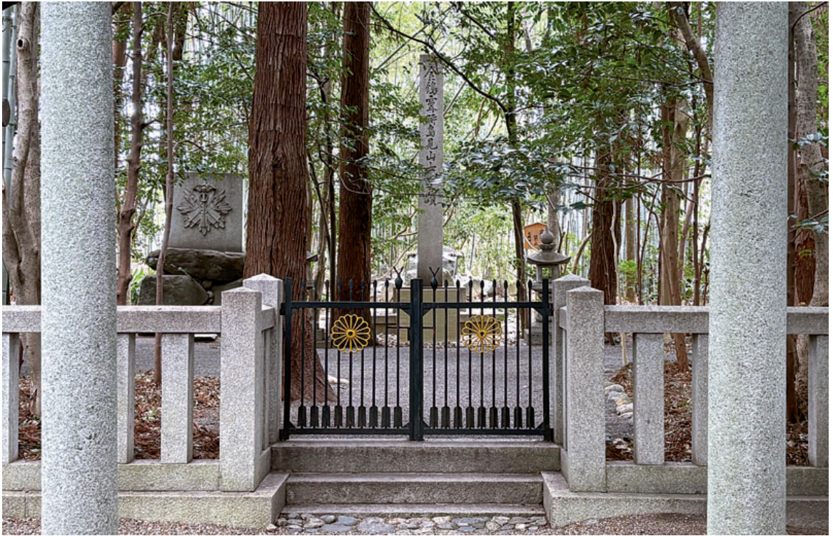
現在の大倭神宮 (青山法義さん撮影・文3頁)

★発行日 令和8年3月23日 ★発行所 大倭出版局 〒631-0042 奈良市大倭町1の12 ☎(0742)45-1192 ★印刷 大倭印刷 ★定価 1部 300円 年間購読料3,500円(送料共) ★郵便振替 01050-6-67002 大倭出版局 URL http://www.ohyamato.jp