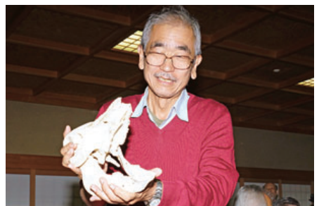
動物の骨の実物を紹介する先生

思うのですが、公演中の私の頭の中はマイクは大丈夫か、パソコンは、写真を撮らないと……と、周辺のことが気になって、先生の話の内容があまり頭に残っていません。でも先ほども書きました、先生の楽しそうな雰囲気味わうことはできました。参加者のお一人から「中学校や高校でこのような授業をしてもらっていたら……」との声を聴けたことで、参加者は楽しく聴いていたのではと、ホッと胸をなでおろしました。